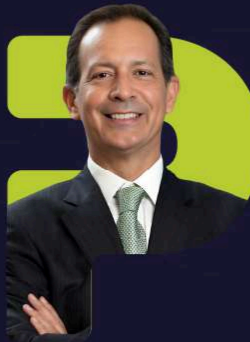
Santiago Camarena Alpha Puesto de Bolsa